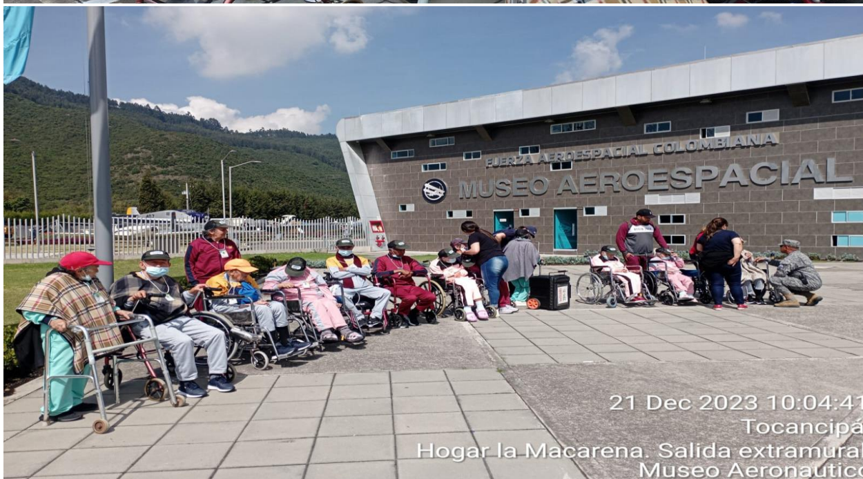
21 Dec 2023 10:04:41 Tocancipá Hogar la Macarena. Salida extramural Museo Aeronautico