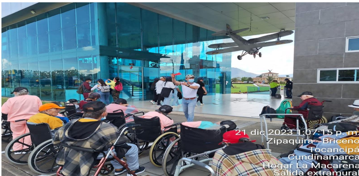
21 dic 2023 1:07:15 p. m. Zipaquira - Briceno Tocancipá Cundinamarca Hogar La Macarena Salida extramural