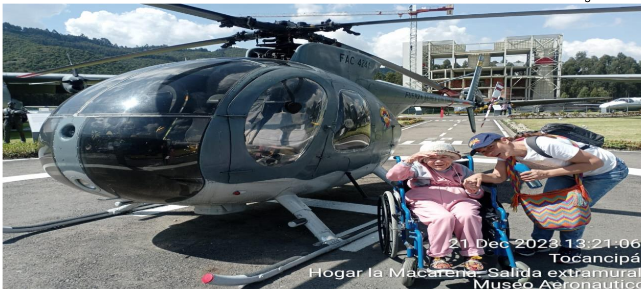
21 Dec 2023 13:21:06 Tocancipá Hogar la Macarena - Salida extramural Museo Aeronautico