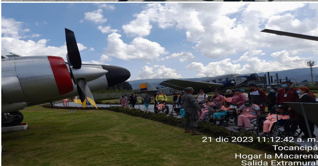
21 dic 2023 11:12:42 a. m. Tocancipá Hogar la Macarena Salida Extramural